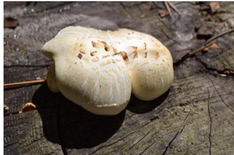
乾燥してもがんばる／マツオウジ