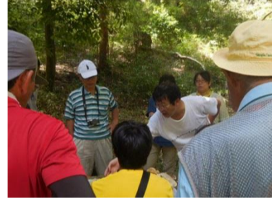
虫草はなかったけど 久しぶりの解説