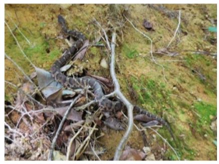
水を求めて...／ニホンマムシ