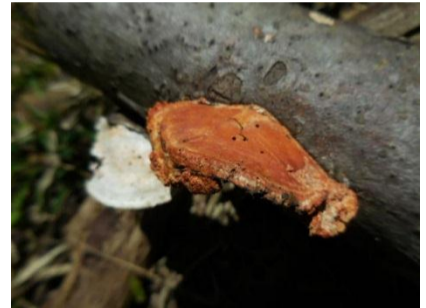
めでたく紅白／ヒイロタケ