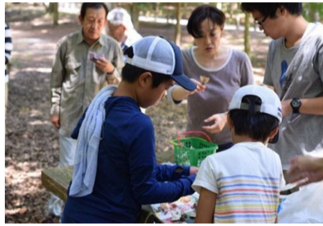
夏休み 子供達は元気！