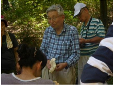
長老の為になるお話