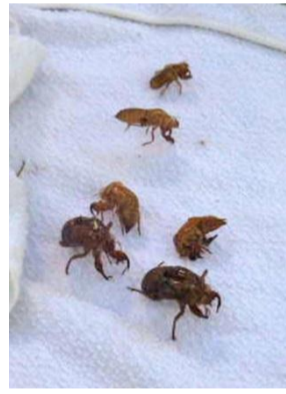
抜け殻コレクション