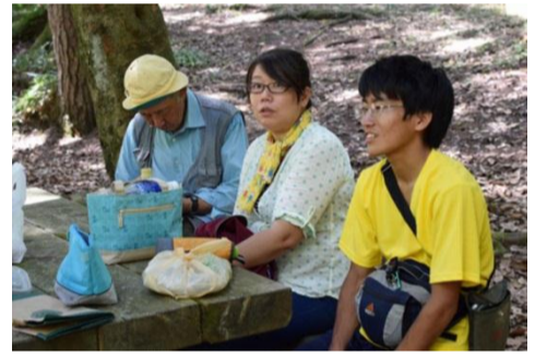
黄色コレクション