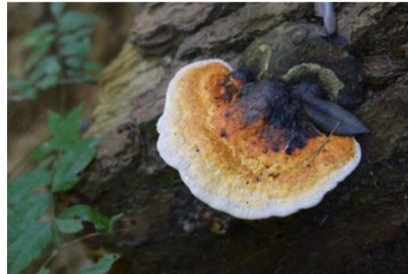
乾燥をもろともせず／ツガサルノコシカケ