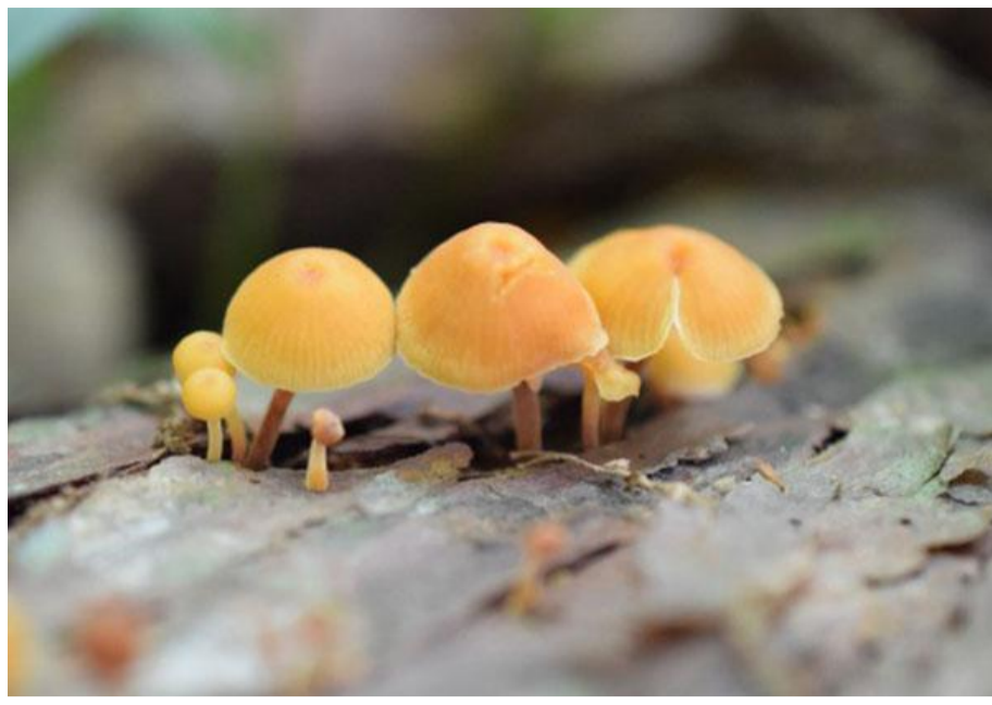
健気に肩を寄せ合う／ヒメカバイロタケ

土がパサパサで乾燥していたため、去年の8月や先月に比べてキノコはかなり少なめ。キノコがなかなか見つからない上に、まだまだ暑さ厳しくダウンしそうになりました。しとしと雨恋しですね。それでも、見つけるのが得意な方は独自の視点でキノコをかごいっぱい採取していらっしゃいました(すごい！)