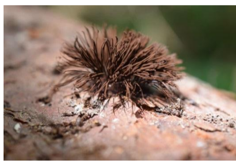
もののけ姫のタタリ神？／ムラサキホコリ